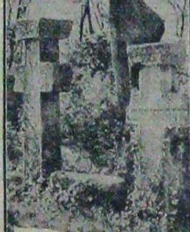
Moartea lui Ciurul vel logofătul.

Și în jurul acestui aspect specific, de înfrățire a gândului morții, în jurul felului acela osebii de a o accepta, în jurul semnificației suferinței de viață a fiecărui neam, poartă toate înțelegerile și răspunsurile cu privire la destinele popoarelor din lumea întreagă.